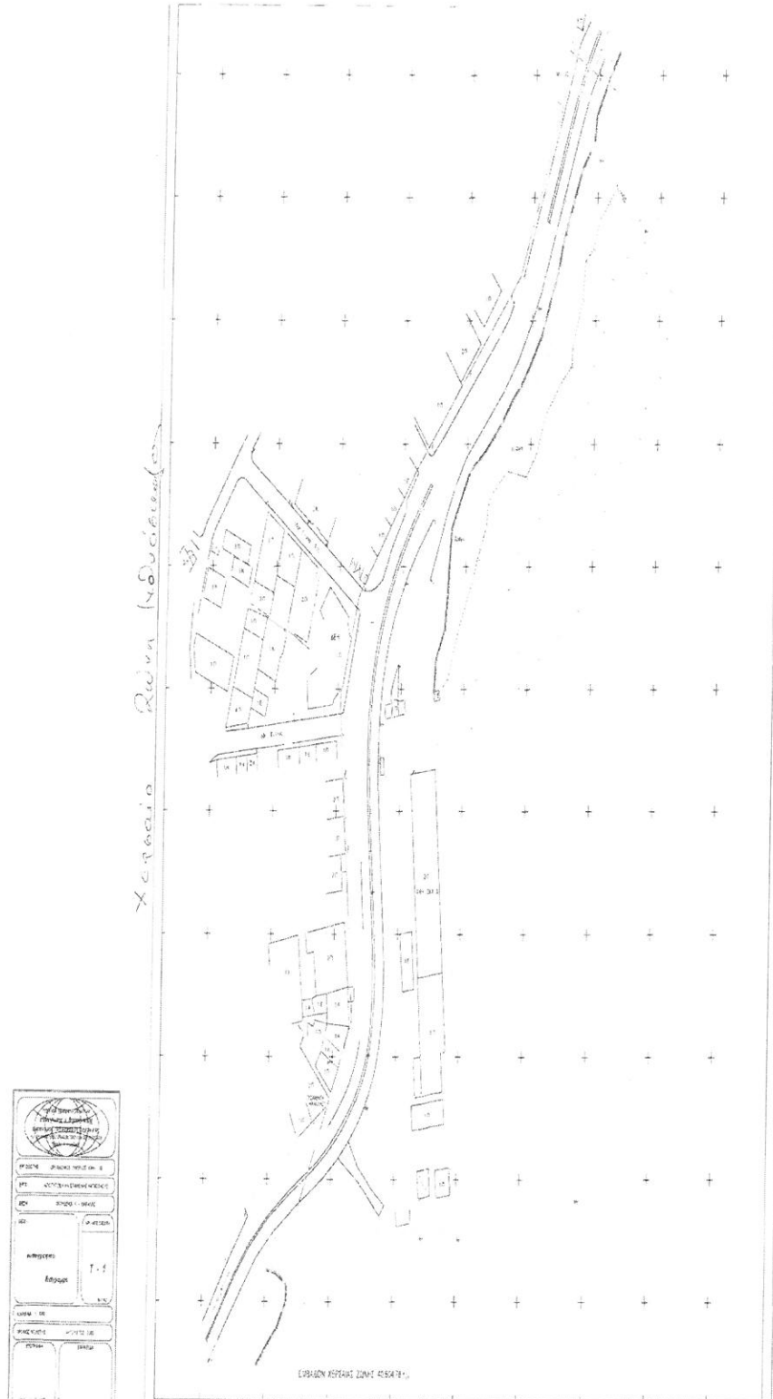
τοπογραφικό διάγραμμα (2) ΧΖΛ Καβάλας, Περιοχή Ιχθυόσκαλας.